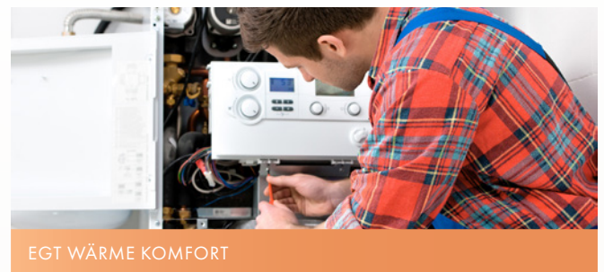
EGT WÄRME KOMFORT

Die Rechnung immer zur Hand haben, Zählerstände eingeben oder Abschlag selbst festlegen: mit dem EGT-Kundenportal. www.egt.de/kundenportal